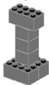
Рисунок 2: «Этап 2 конструирования модели светофора»

- Потом, ребята, мы берем 2 кирпичика 2*2 серого цвета и один кирпичик 2*2 красного цвета.