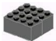
Рисунок 1: «Этап 1 конструирования модели светофора»

(Педагог демонстрирует воспитанникам кирпичики и выполнение 1 этапа работы. Воспитанники повторяют)