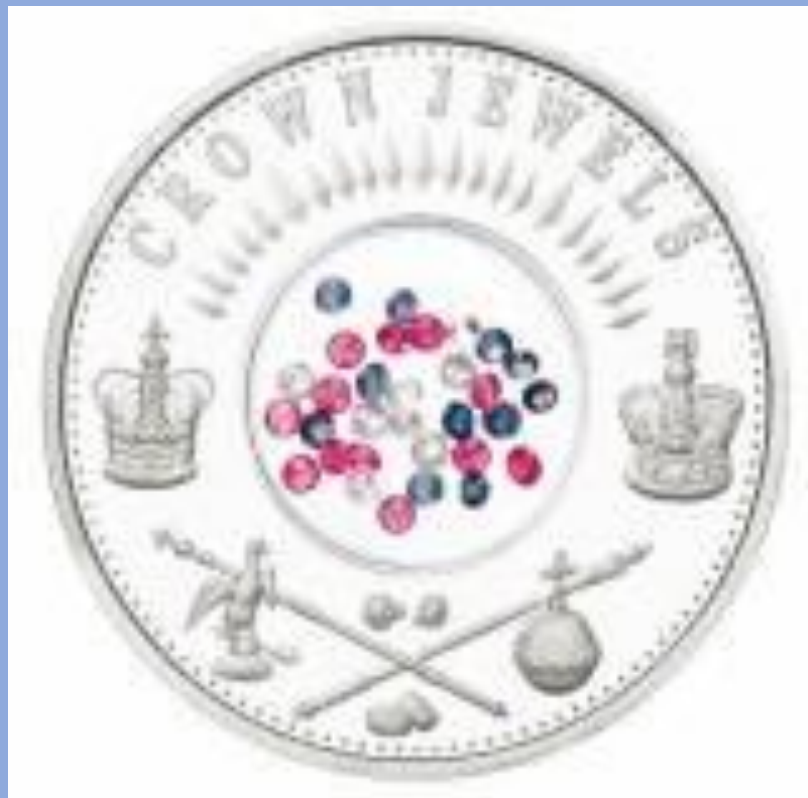
Монеты со вставками драгоценных и полудрагоценных камней