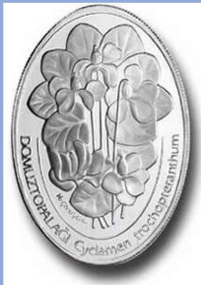
Овальные монеты «Цветы Турции»