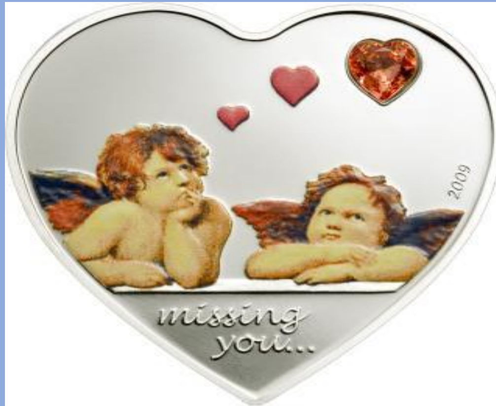
Монета «Скучаю по тебе». Серебро, эмаль, кристалл Сваровски