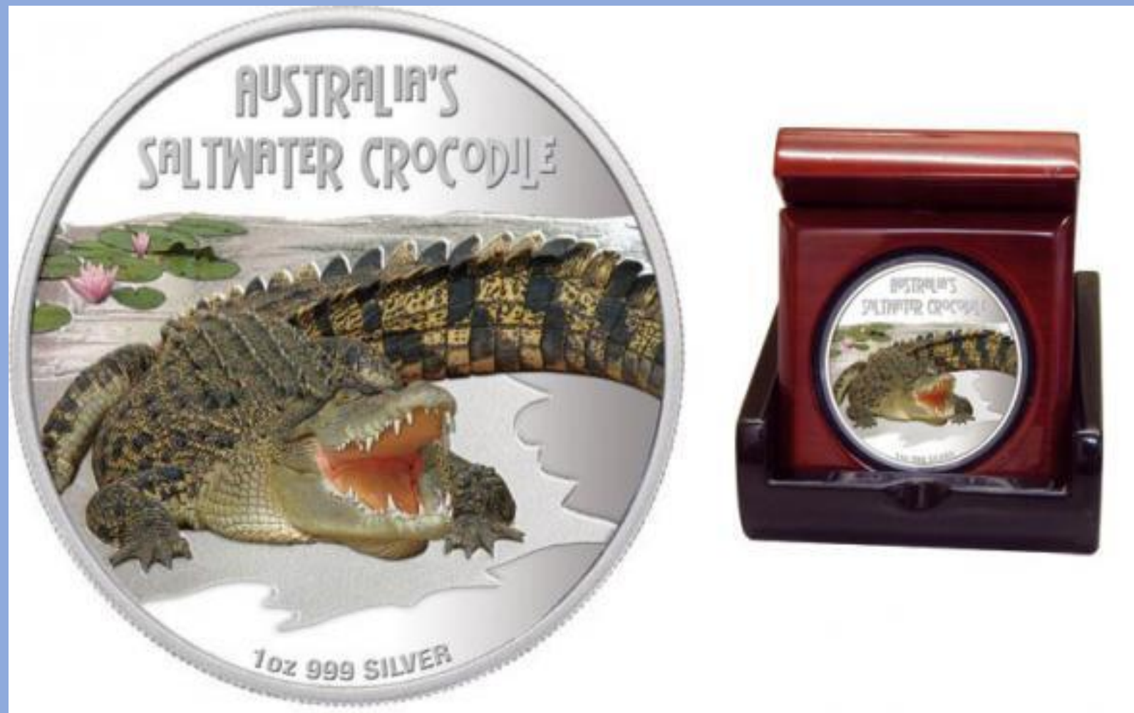
Серия «Опасные животные» Тувалу, 1 доллар, серебро 999