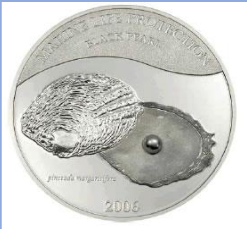
Монета с настоящей черной жемчужиной