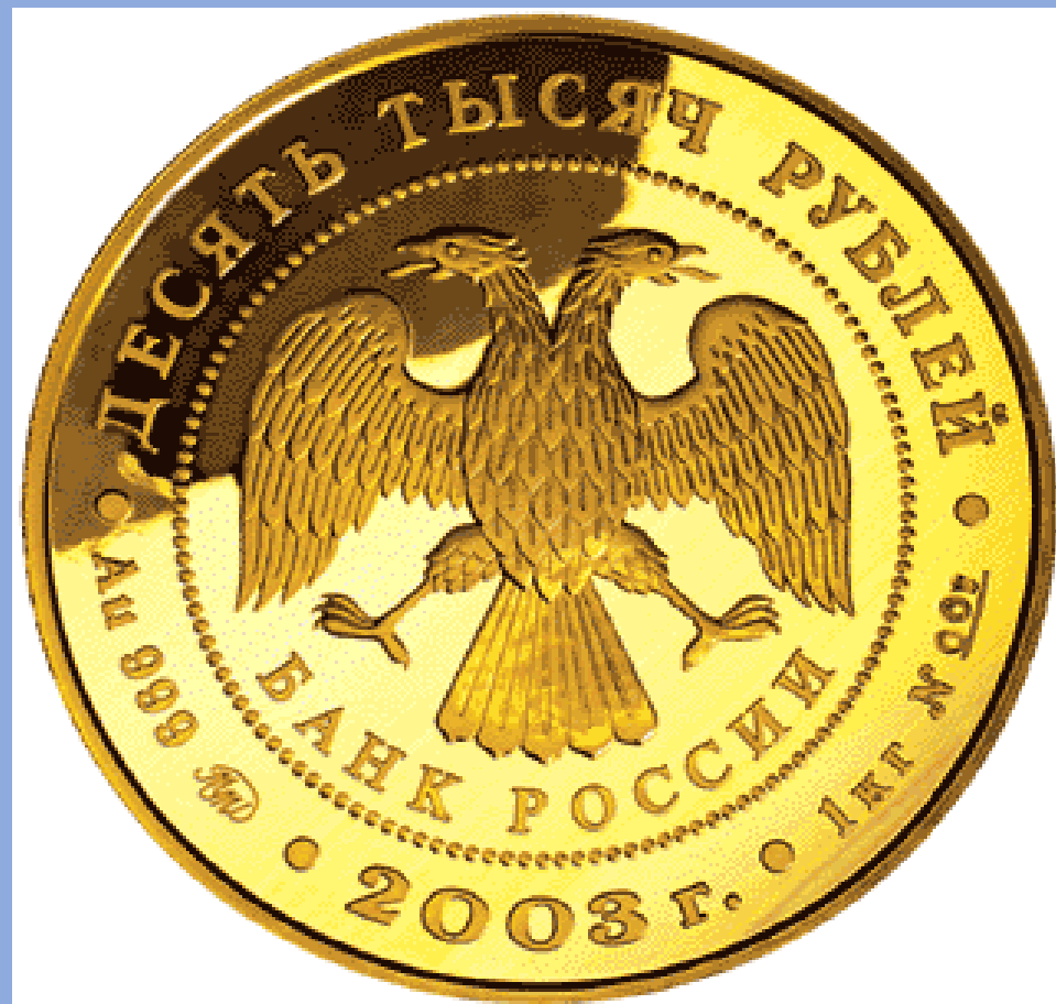
Центральный банк РФ. Трёхкиллограммовая серебряная монета и килограммовая – золотая.