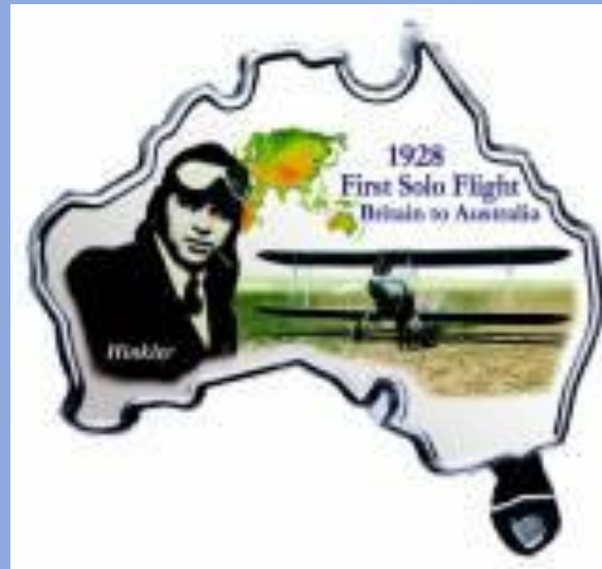
Монеты в форме Австралийского континента