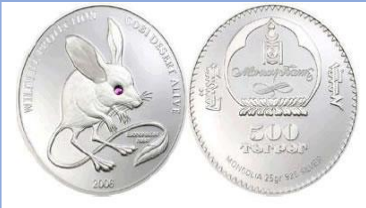
Серебряная монета с кристаллом Сваровски