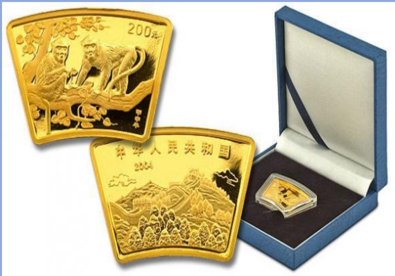
Китайские монеты в виде веера. Серия «Китайский календарь», Золото, Серебро 999